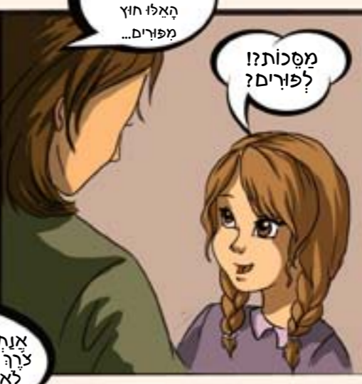
שבוצים לפני כן. כוונות.