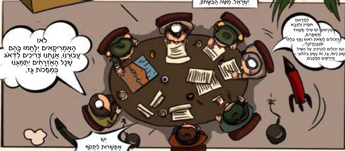
ישראל, מטה הבטחון.

לא האמריקאים ילחמו בהם עבורנו. אנחנו צריכים לדאג שכל האזרחים יתמגנו במסכות גז.