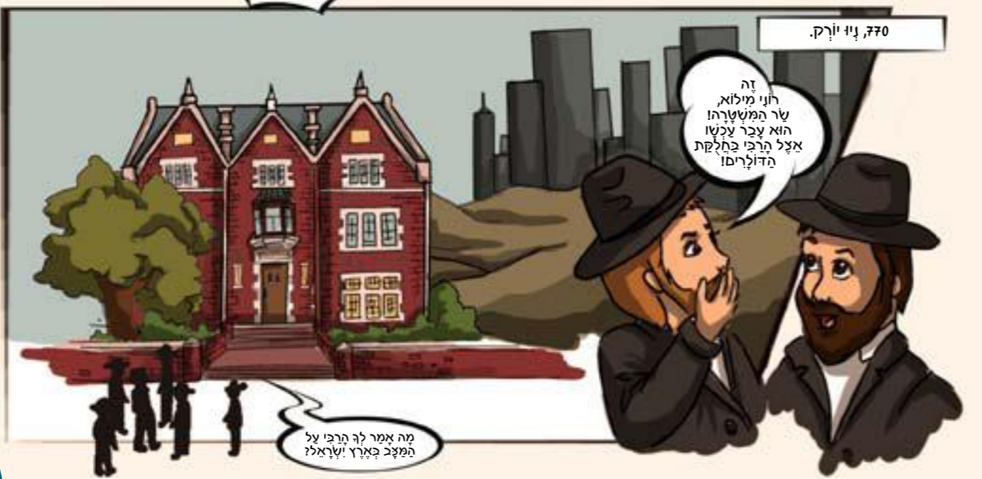
770, בני יורק.

זה רחוב מילוא, שר המשטרה הוא עבר עכשו אצל הרב'ה בחלקת הדולריס!